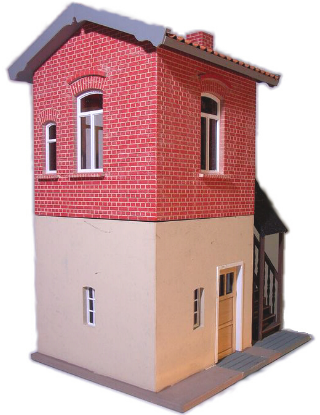
6005 Blockstelle „Hottendorf“